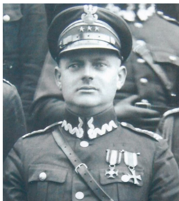
GENERAL WINCENTY NOWACZYŃSKI - bohaterki syn Ziemi Międzychodzkiej