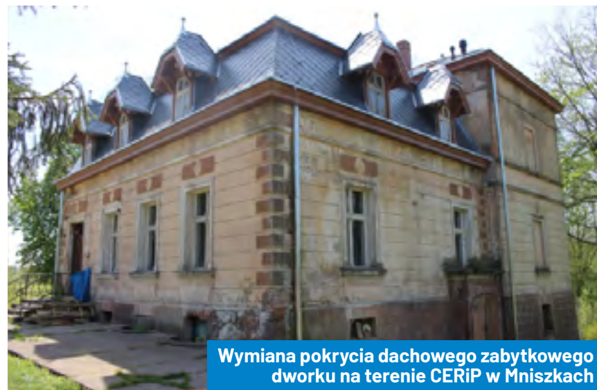
Wymiana pokrycia dachowego zabytkowego dworku na terenie CERiP w Mniszkach