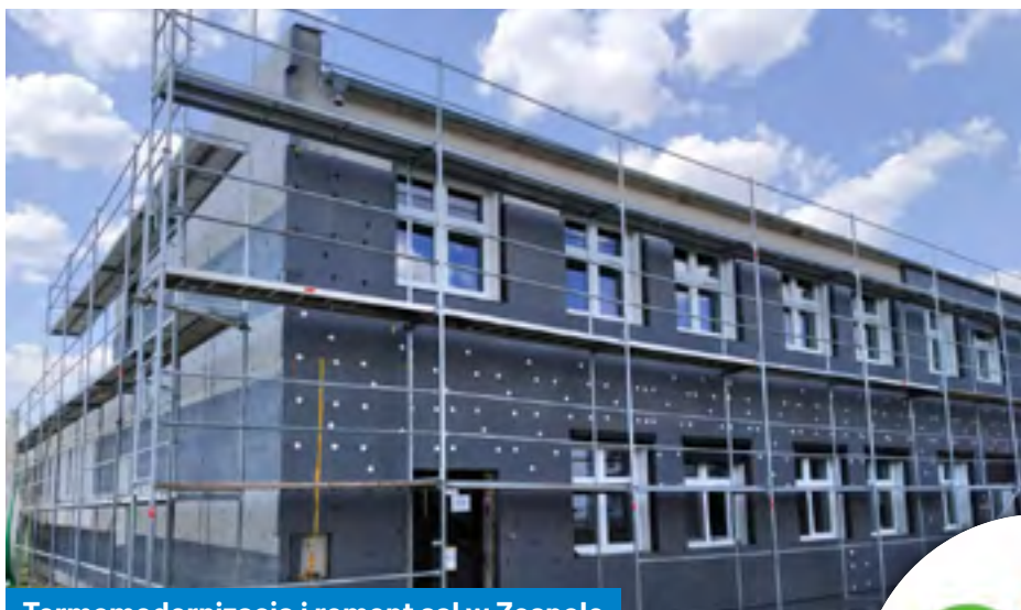
Termomodernizacja i remont sal w Zespole Szkolno-Przedszkolnym w Kamionnie