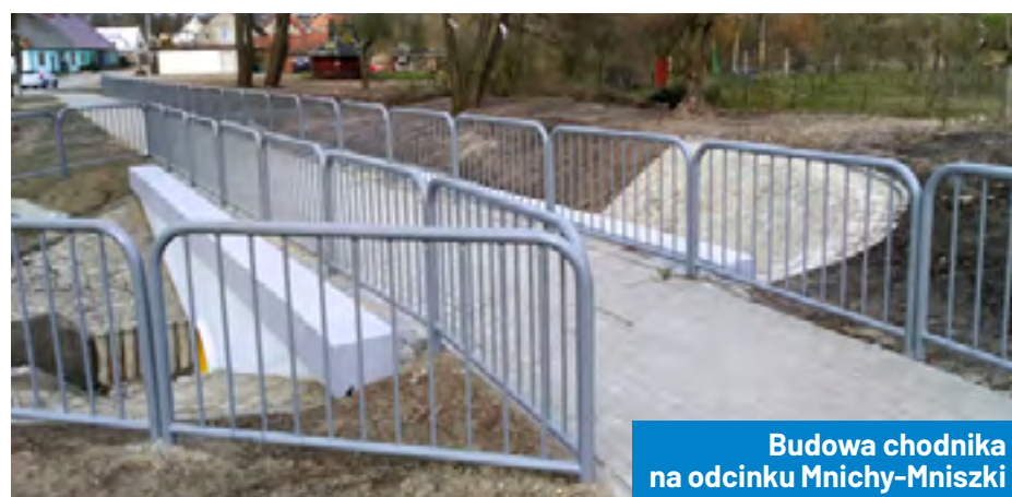
Budowa chodnika na odcinku Mnichy-Mniszki