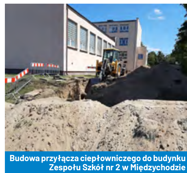
Budowa przyłącza ciepłowniczego do budynku Zespołu Szkół nr 2 w Międzychodzie