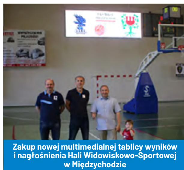
Zakup nowej multimedialnej tablicy wyników i nagłośnienia Hali Widowiskowo-Sportowej w Międzychodzie