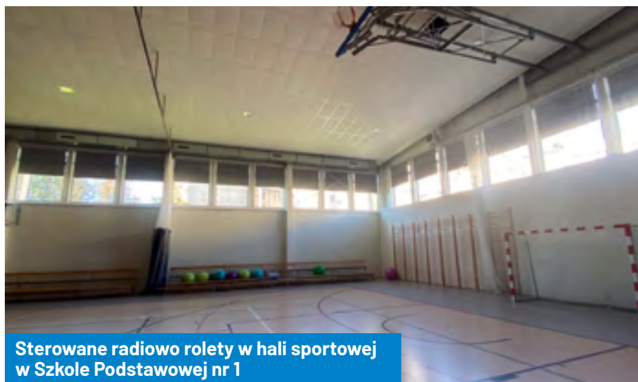
Sterowane radiowo rolety w hali sportowej w Szkole Podstawowej nr 1