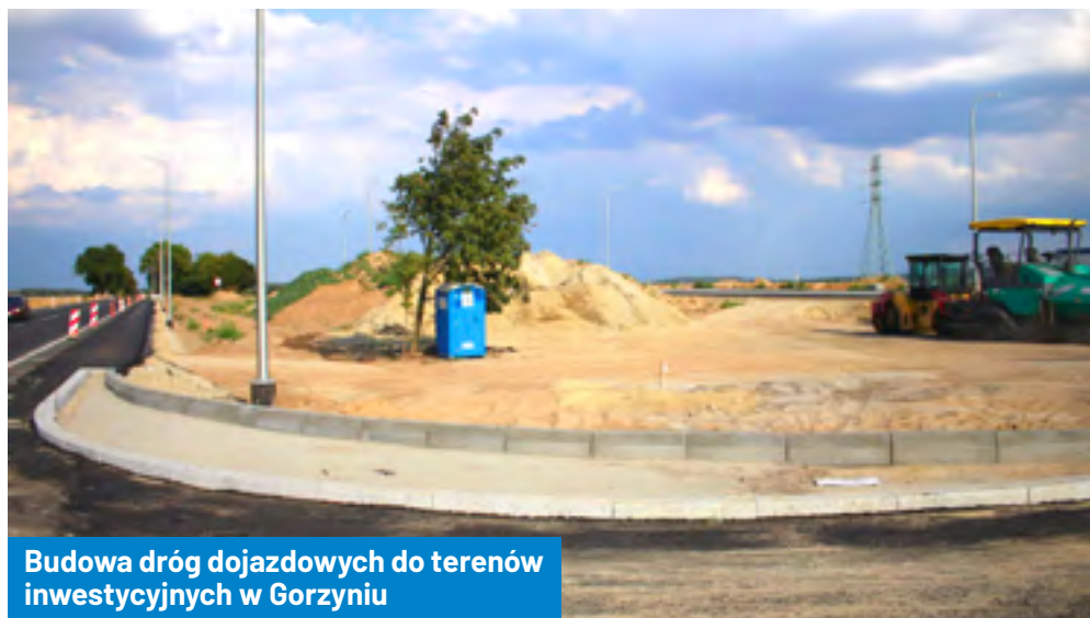
Budowa dróg dojazdowych do terenów inwestycyjnych w Gorzyniu