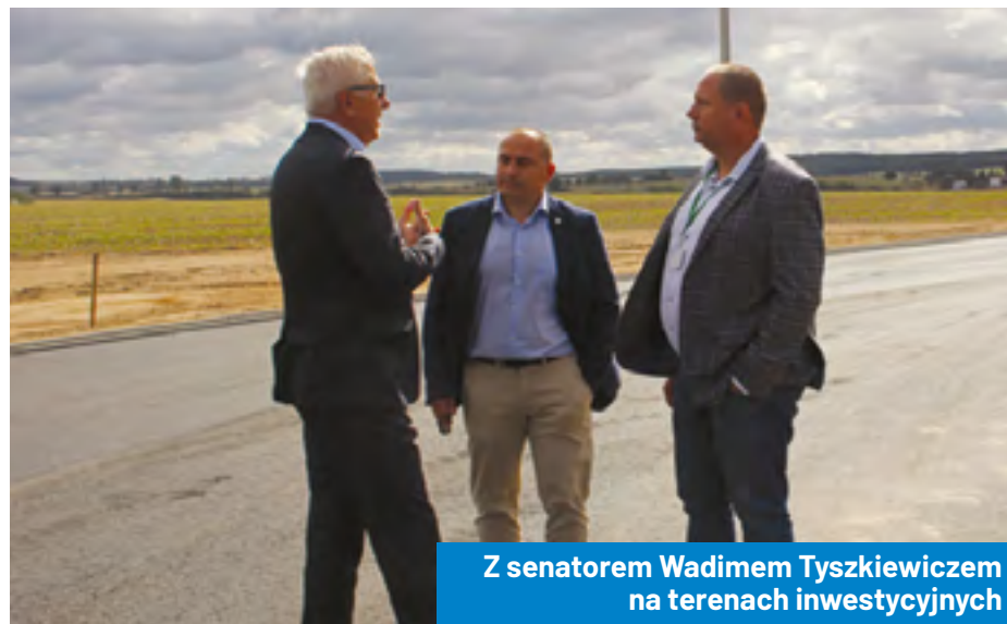
Z senatorem Wadimem Tyszkiewiczem na terenach inwestycyjnych

Wymienione zostało pokrycie dachowe zabytkowego dworku w Mniszkach. Podjęto też szereg inwestycji drogowych – m.in. na terenie dawnego ośrodka wypoczynkowego w Mierzynie czy drogi dojazdowe do terenów inwestycyjnych w Gorzynie. Przebudowano także ulicę Zaułek Rzeczny, co połączone z wymianą sieci instalacji gazowej i wodnej oraz budową kanalizacji deszczowej. Powstał także chodnik na odcinku Mnichy–Mniszki, a na przystankach autobusowych w Międzychodzie i Bielsku pojawiły się nowe, estetyczne wiaty. Zrealizowano również szereg działań w budynkach oświatowych, trwają prace w Muzeum Regionalnym, rusza też remont wiaduktu nad linią kolejową w Głazewie. /KŻ.