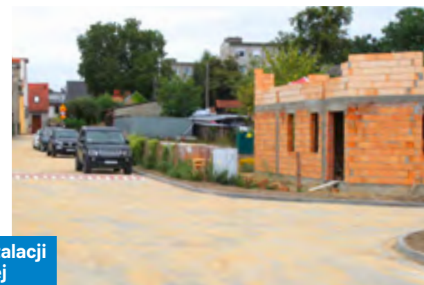
Przebudowa ul. Zaułek Rzeczny wraz z wymianą sieci instalacji gazowej i wodnej oraz budową kanalizacji deszczowej