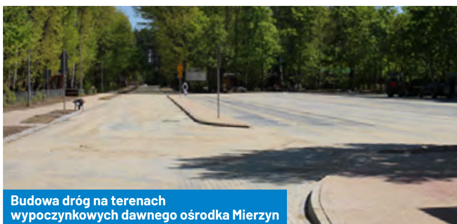
Budowa dróg na terenach wypoczynkowych dawnego ośrodka Mierzyn