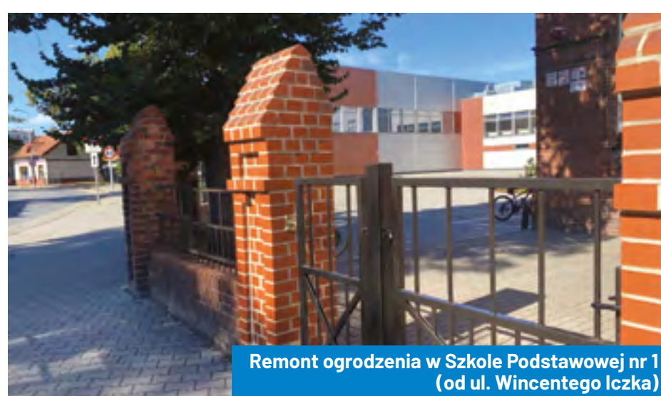
Remont ogrodzenia w Szkole Podstawowej nr 1 (od ul. Wincentego Iczka)