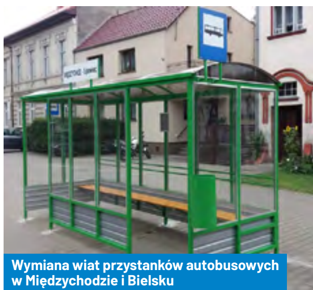
Wymiana wiat przystanków autobusowych w Międzychodzie i Bielsku