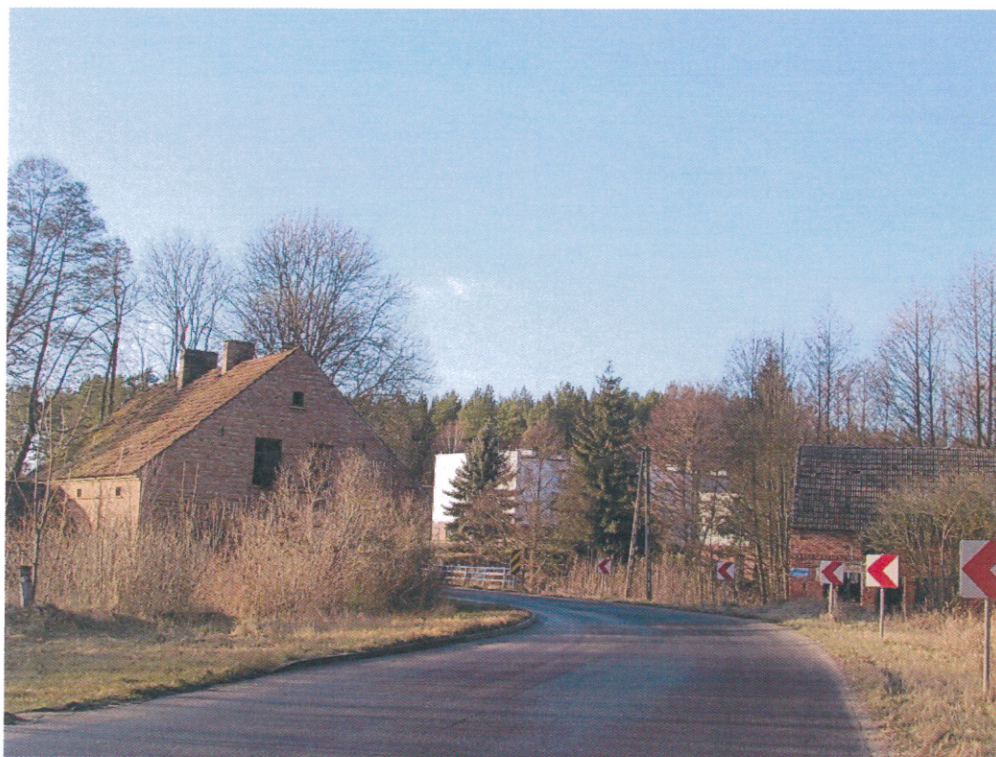
ilustracja 2. Zamyślin

Do 1873 r. była to kolonia w dobrach wiejeckich. Założyciele osady mieli się tu osiedlić ok. 1600 r. Data założenia olędrow pozostaje nieznana. Czasami datuje się je na II poł. XVII w. Liczyły one zrazu 13 dymów. Gmina liczyła w 1890 r. 217 ha, w 1908 r. – 215, w 1930 r. – 214,5 ha. W 1905 r. spisano tu 19 gospodarstw domowych, w 1925 r. – 19, w 1939 r. – 20. Były tu 4 gospodarstwa rolne o pow. 0,5-5 ha, 2 – 5-10 ha, 5 – 10-20, 2 – 20-100 ha. Liczba domów w 1837 r. zmniejszyła się do 11 (razem z młynem – 13), w l. 1885-1905 było ich 16, ale w 1925 r. – 14. W 1837 r. doliczono się tu 88 dusz (razem z młynem – 100), w 1885 r. spisano 108, w 1905 r. – 85, w 1910 r. – 88, w 1925 r. – 72, a w 1939 r. już tylko 65. Po wojnie liczba ludności jeszcze bardziej się zmniejszyła, w 1995 r. – 20 osób, ale w 2003 r. – 43. Przed 1945 r. wieś zdecydowanie protestancka. W 1885 r. mieszkało tu 5 katolików, w 1905 r. – 8, w 1925 r. – 2. Już w 1905 r. wszyscy mieszkańcy byli Niemcami. Ludność utrzymywała się rolnictwa i leśnictwa. W 1939 r. było tu tylko 6 robotników oraz 21 urzędników.