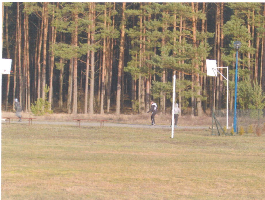
Ilustracja 14. Teren przy boisku piłkarskim w Piłce, na którym powstanie uniwersalne boisko do siatkówki, tenisa ziemnego, koszykówki, a całość zostanie ogrodzona i oświetlona. (źródło: UMiG Międzychód)