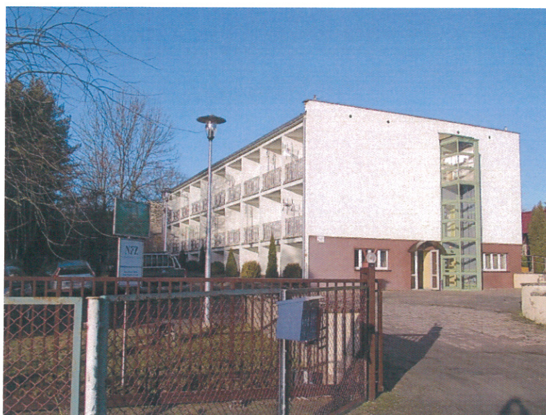
Ilustracja 5. Dom Pomocy Społecznej, budynek w Zamyślinie