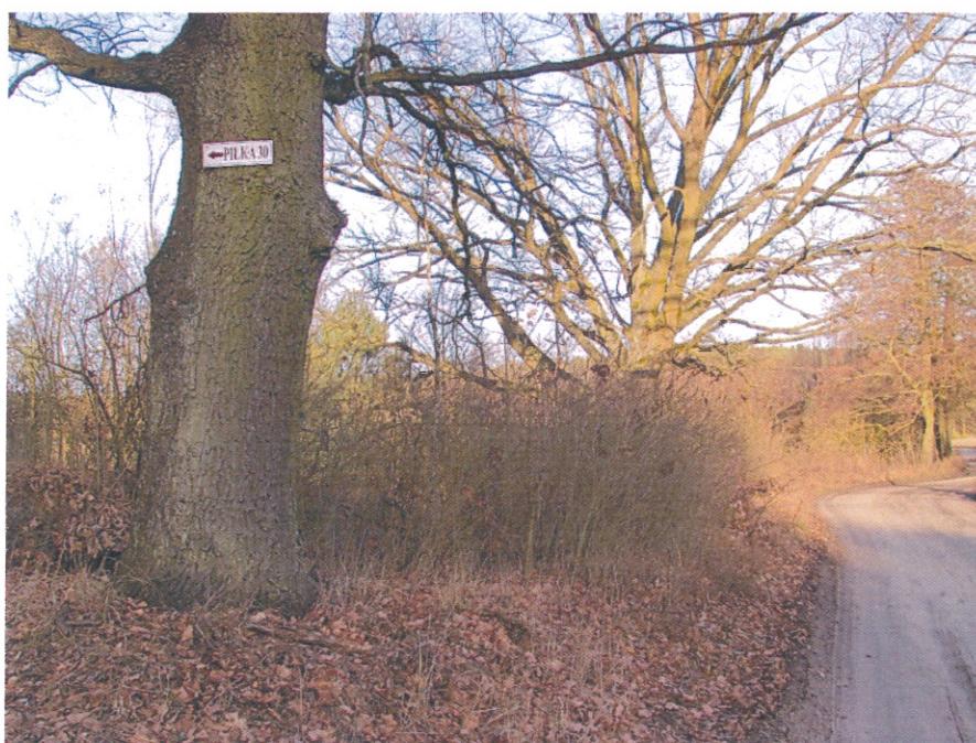
ilustracja 6. Rozproszona zabudowa wsi Piłka, utrudniony dojazd

Dla sołectwa Piłka charakterystyczne jest osadnictwo puszczańskie i pozostałości po Olędрах, którzy kolonizowali tereny Puszczy Noteckiej. Należy tu wyliczyć rozproszenie zabudowań poszczególnych gospodarstw i pola uprawne na polanach pozyskanych w środku lasów. Do zabudowy skupionej należy teren wokół Domu Pomocy Społecznej w Piłce, oraz Zamyślin. Osobną grupę osadniczą stanowią gospodarstwa nr 2 – 21 (nazywane "drugą Piłką"). Poza tym słaby jest dostęp komunikacyjny i utrzymane tradycyjne źródła codziennego utrzymania – rolnictwo, gospodarka leśna i praca w Nadleśnictwie. Do tego doszła ostatnio praca w Domu Pomocy Społecznej. W Piłce nie ma specyficznego folkloru ani tradycji ludowych.