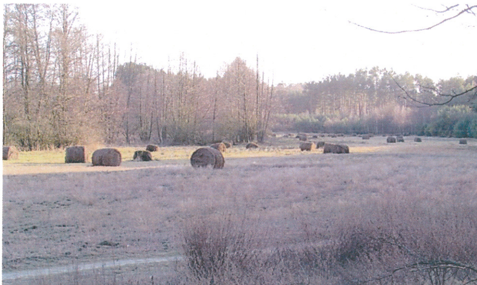
ilustracja 7. Krajobraz rolniczy Piłki – pola wśród lasów Puszczy Noteckiej