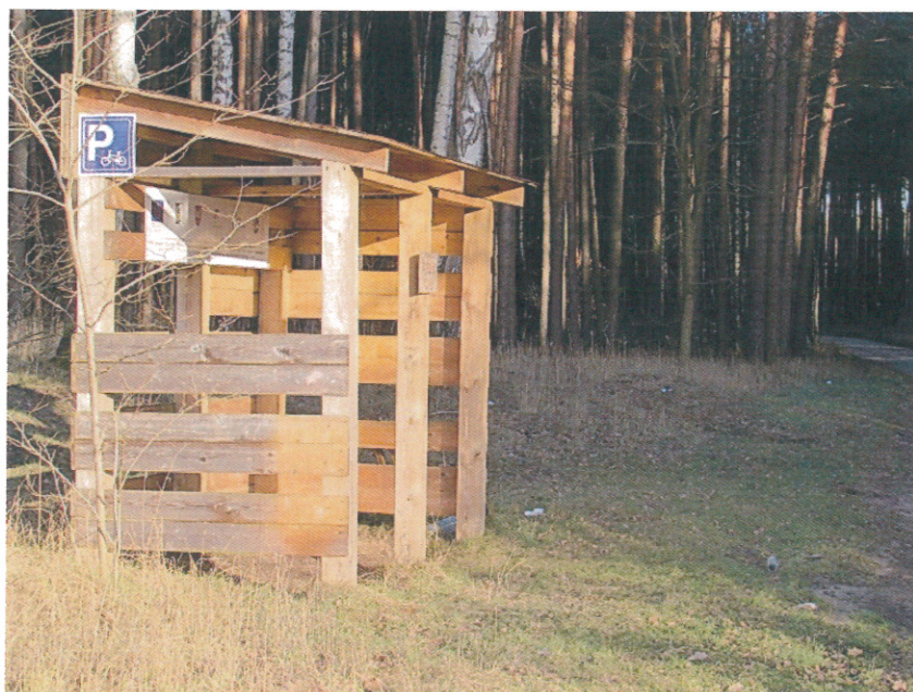
ilustracja 15. Wiata dla turystów rowerowych przy szlaku żółtym w Zamyślinie

Wszystko to będzie możliwe dzięki budowie obiektu we wsi Piłka. Przyczyni się to do integracji środowiska wiejskiego, jako pierwszej tego typu placówki w sołectwie. Ponadto wpłynie to na odnowę tego terenu i zwiększy jego atrakcyjność. Powstanie wtedy również możliwość utworzenia ogólnodostępnej kafejki internetowej, w której każdy z mieszkańców będzie miał możliwość darmowego dostępu do internetu. Potrzeba będzie wtedy dużego nacisku na poprawę estetyki i nowego zagospodarowania terenu wokół budynku (świetlicy) i poprawienie stanu terenu przyległego.