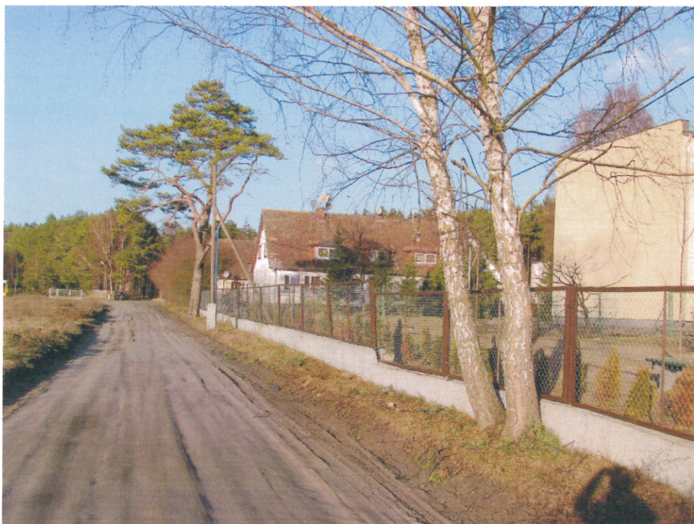
Ilustracja 10. Droga gruntowa przy DPS, która zostanie wyrównana i utwardzona, brak chodnika.