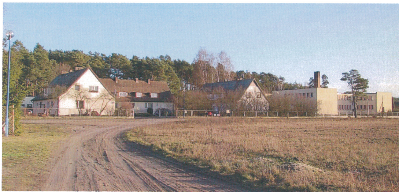
ilustracja 3. Zabudowa Piłki przy Domu Pomocy Społecznej

*opracowane na podstawie: "Monografia Międzychodu" Jerzy Zysnarski, lipiec 2005