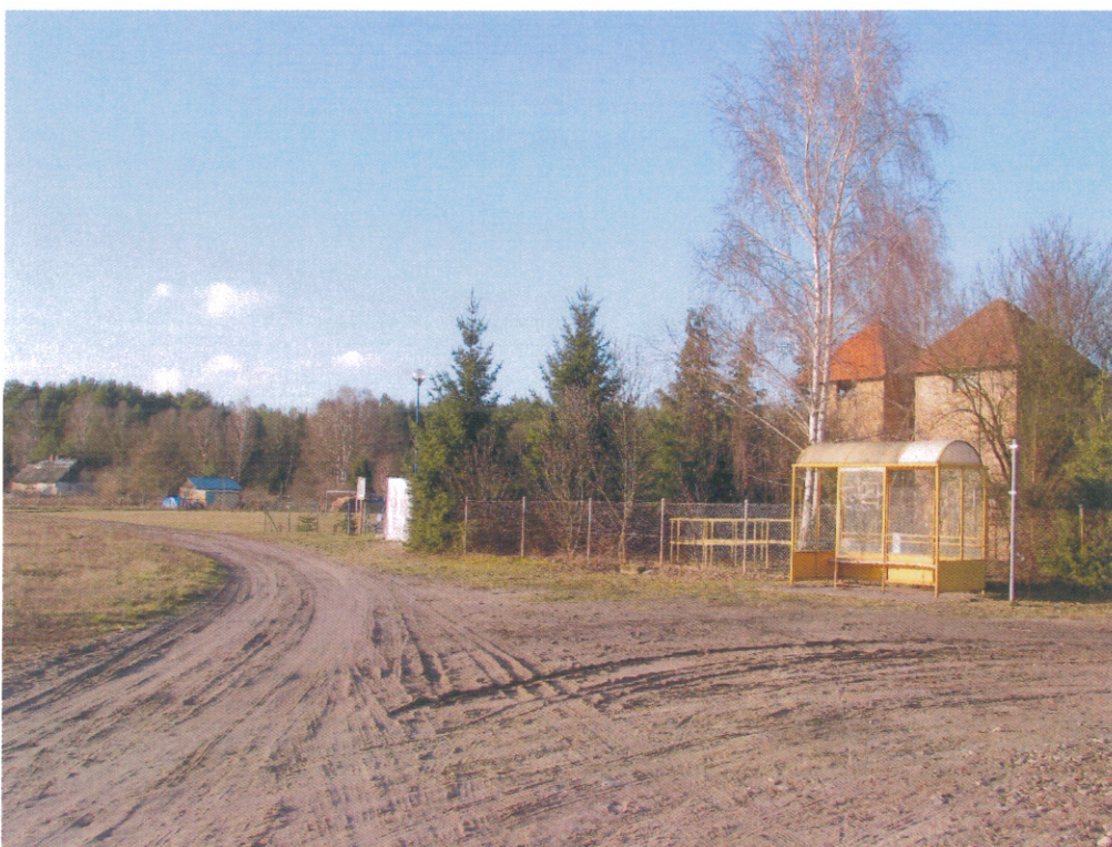
Ilustracja 13. Teren na którym może być miejsce postojowe dla turystów i grzybiarzy, obok - miejsce na świetlicę i strażnicę Ochotniczej Straży Pożarnej .