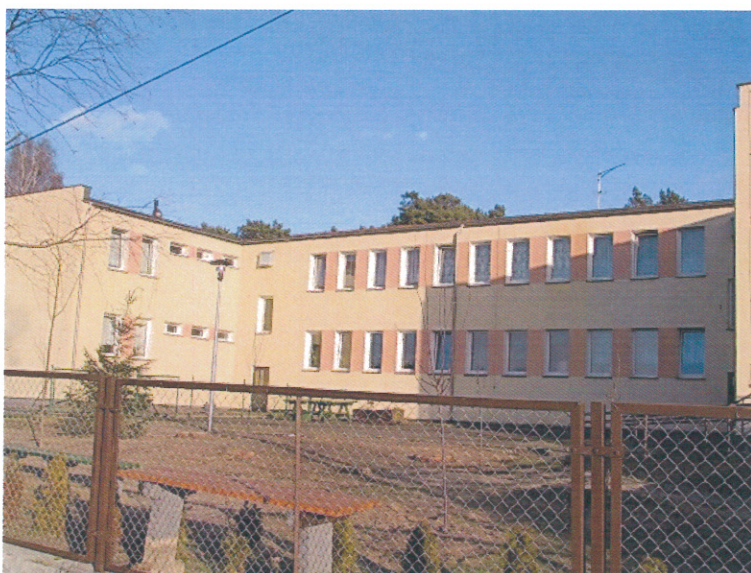
Ilustracja 4. Dom Pomocy Społecznej w Piłce

Miejscowości wchodzące w skład sołectwa Piłka leżą na skraju Puszczy Noteckiej wzdłuż drogi wojewódzkiej nr 199, która biegnie wzdłuż koryta rzeki Warty i na północ od tej drogi, ok. 2-3 km. w głąb lasu. Przysiółek Zamyślin sąsiaduje ze wsią Piłka i także dojeżdża się do niego z wymienionej drogi. Oprócz nowo wybudowanych zabudowań DPS i kilku domów mieszkalnych większość zabudowy stanowią stare domy z cegły oraz kilka gospodarstw po osadnikach olenderskich. We wsi Piłka funkcjonuje Dom Pomocy Społecznej Piłka - Zamyślin, który swoją ofertę kieruje dla chorych dorosłych mężczyzn (Piłka) oraz osób w podeszłym wieku (Zamyślin).