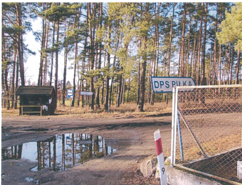
ilustracja 16. Zły stan drogi przy przystanku w miejscowości Zamyślin

Niezbędne jest także uporządkowanie stosunków własnościowych gruntów pod cele społeczne.