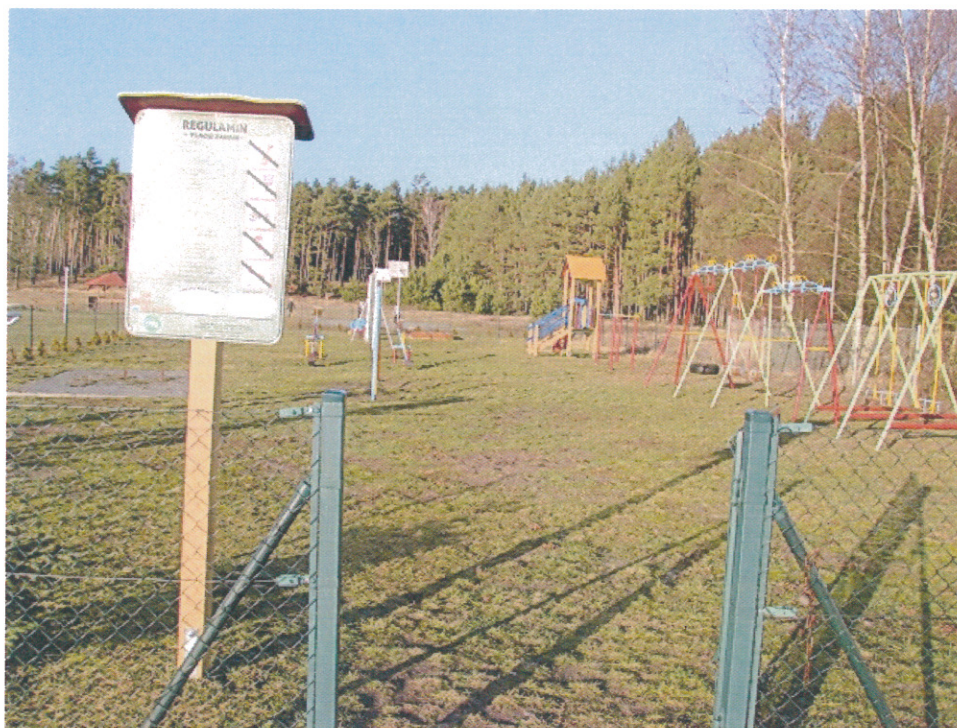
Ilustracja 11. Plac zabaw w Piłce będzie doposażony i oświetlony.