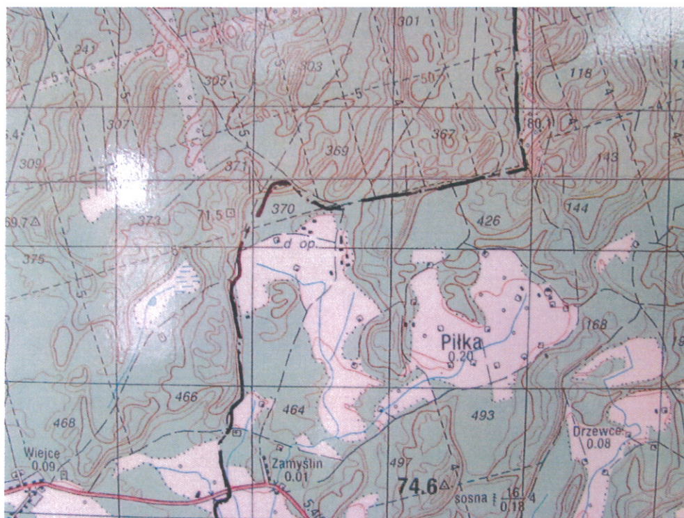
mapa 2. Lokalizacja zabudowań Piłka i Zamyślin.