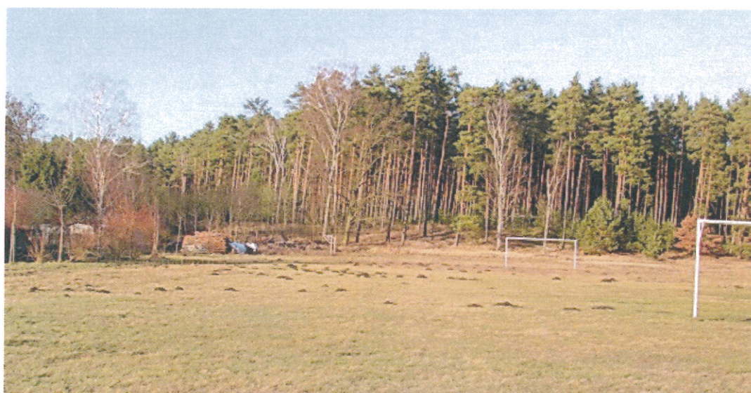
Ilustracja 12. Boisko piłkarskie zostanie odnowione.