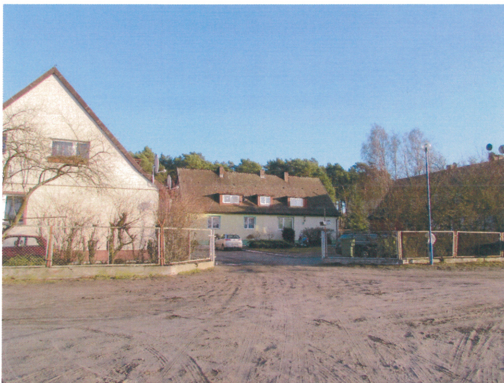
Ilustracja 9. Przedwojenna zabudowa dawnej strażnicy granicznej w Piłce