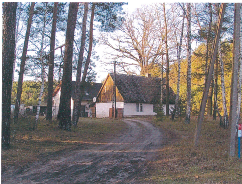
ilustracja 8. Typowa zabudowa rozproszona gospodarstw w sołectwie Piłka