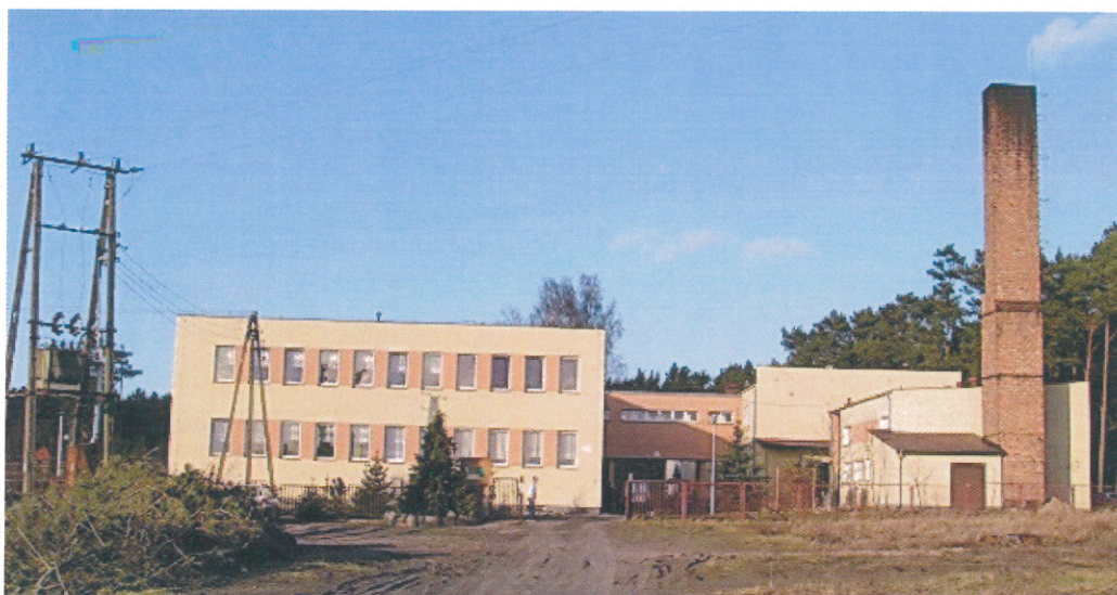
ilustracja 1. Dom Pomocy Społecznej w Piłce

Od lat 70-tych XX wieku znajduje się tu Państwowy Dom Pomocy Społecznej dla Dorosłych. W 1996 r. wojewoda gorzowski wykupił obiekty byłego ośrodka wypoczynkowego Spółdzielni Mleczarskiej w Poznaniu w Zamyślinie w celu adaptacji na dom pomocy społecznej. Aktualnie Dom Pomocy Społecznej Piłka-Zamyślin składa się z dwóch części: dla mężczyzn chorych w Piłce i dla seniorów w Zamyślinie.