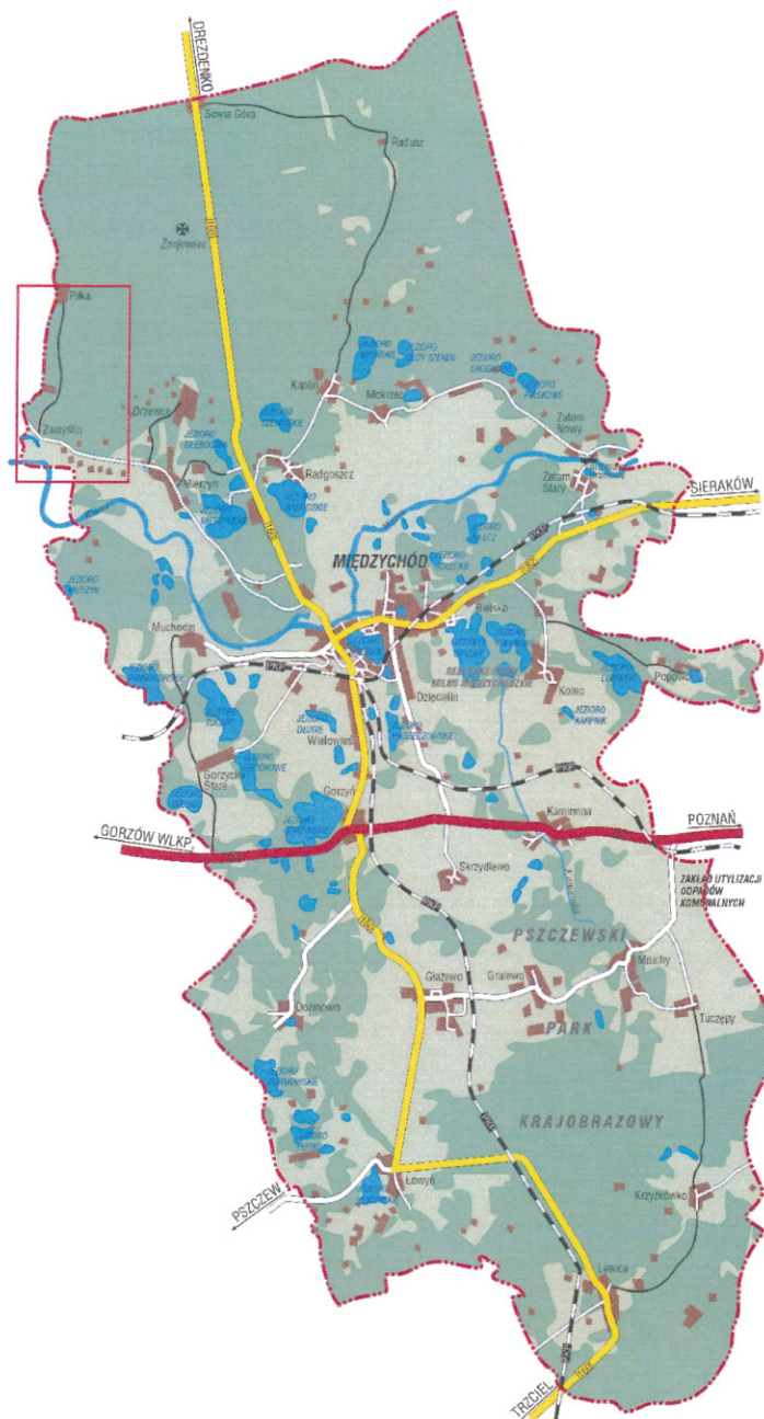
Mapa 1. Położenie sołectwa w gminie Międzychód